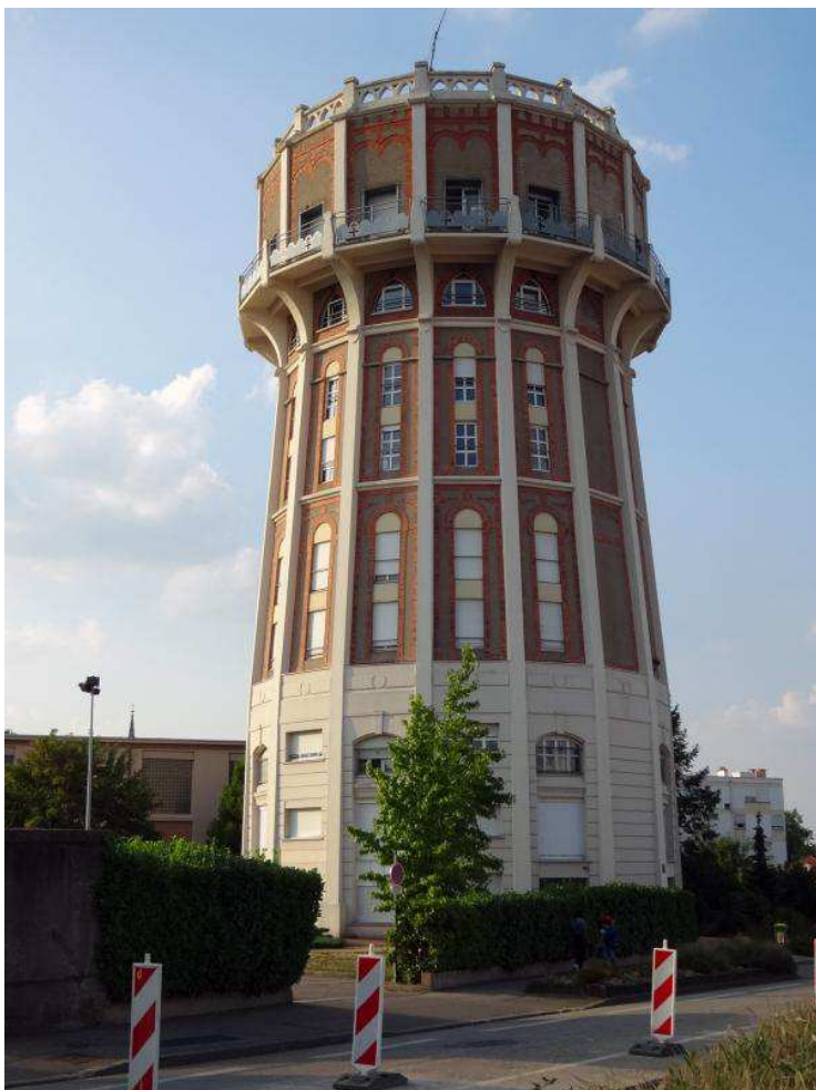
La château d'eau domine les constructions de la rue Gabriel Péri.