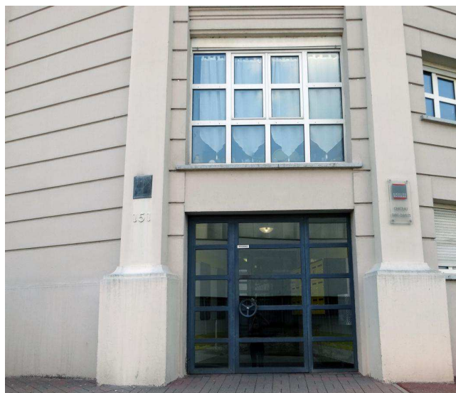
Un nouvel étage intermédiaire vient scinder l'ouverture d'origine de l'entrée.