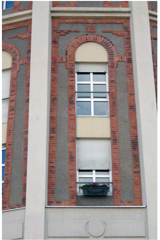
En partie centrale, le remplissage de béton plaqué de briques imite le remplissage d'origine Source : Photographie Elise Pagel-PrévotEAU Droits : URCAUE Lorraine / LHAC

2017 © URCAUE Lorraine - www.itinerairedarchitecture.fr ( http://www.itinerairedarchitecture.fr )