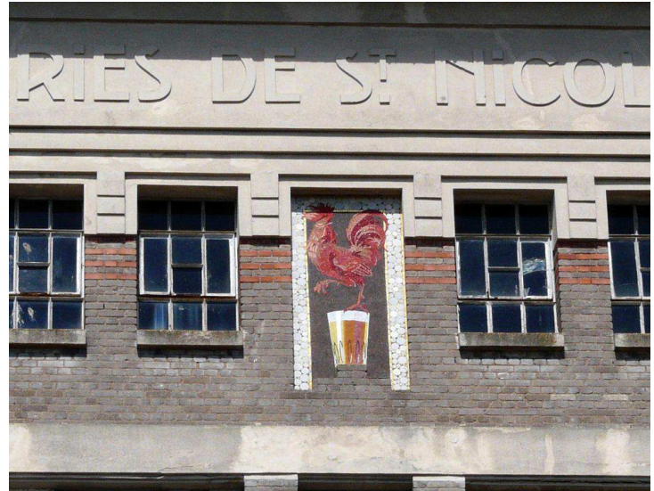
La façade principale est ornée d'un coq en céramique, symbole de la brasserie.