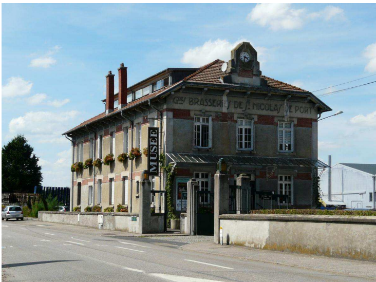
Les bureaux, dominés par une horloge octogonale typiquement Art déco, ont été reconvertis en accueil du musée.