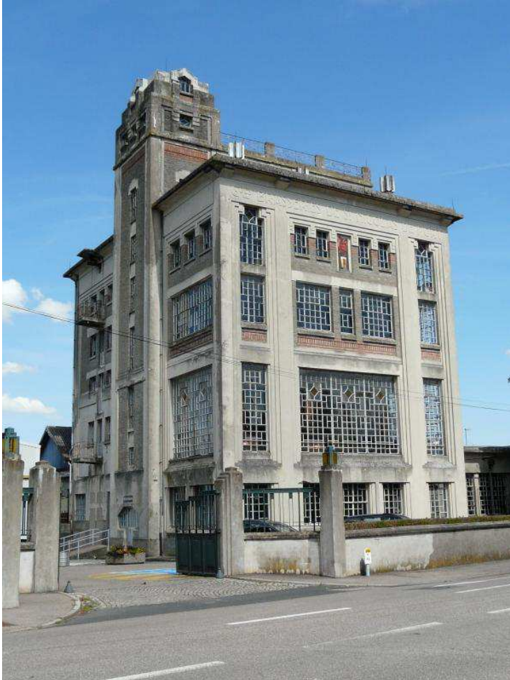
Les larges baies de la façade principale du bâtiment de brasserie laissent voir les cuves de cuivre.