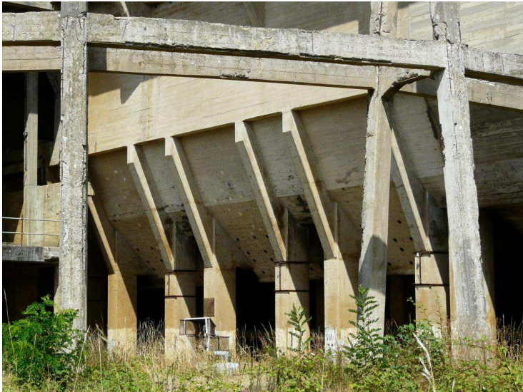
Les silos de l'accumulateur Zublin sont reconnaissables par leur forme trapézoïdale.