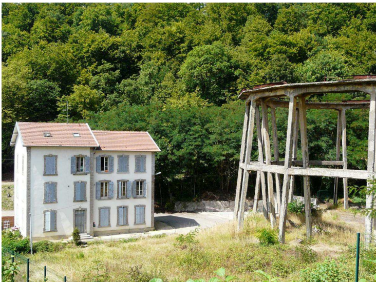
Les anciens bureaux et l'estacade de l'accumulateur Zublin encadrent l'accès au site.