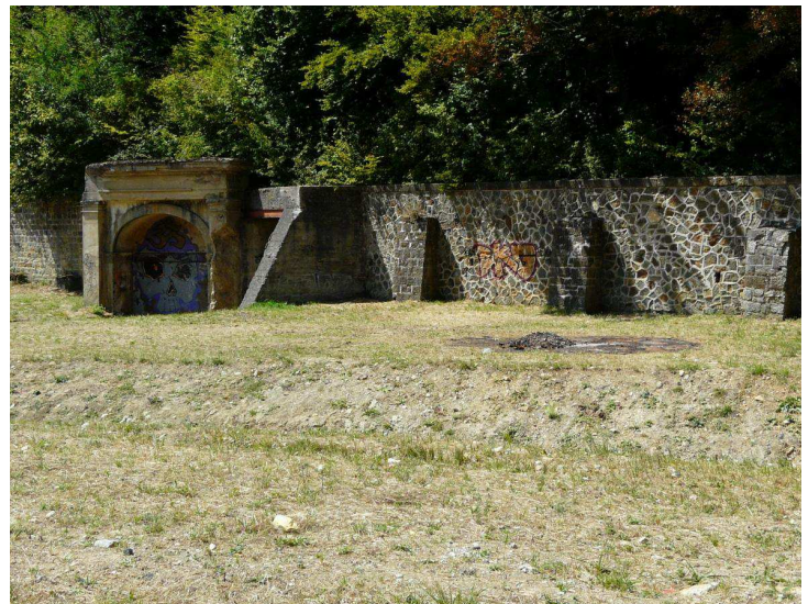
L'ancienne sortie des wagons et le mur d'enceinte font partie des derniers vestiges mis en valeur le long du parcours.