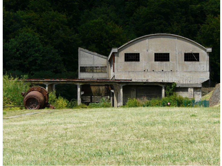
La partie haute de l'accumulateur est visible depuis les terrains aménagés en aire de promenades.