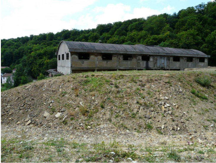
L'accumulateur Zublin est ancré en contre-bas de l'ancien carreau de mine.