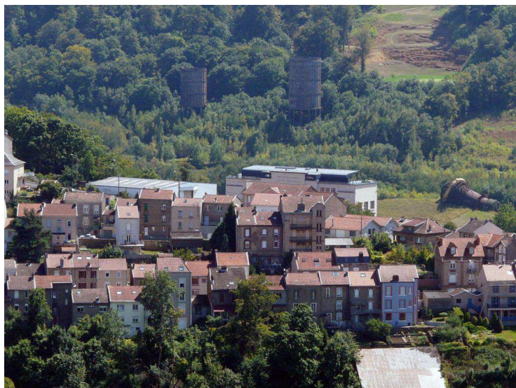
En fond de vallée, les Grands Bureaux et la cuve du haut fourneau sont les derniers témoins de l'activité sidérurgique.