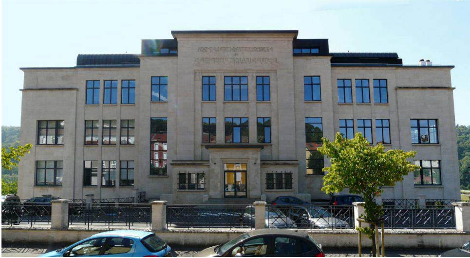
Photographie Elise Pagel-PrévotEAU - © URCAUE Lorraine / LHAC