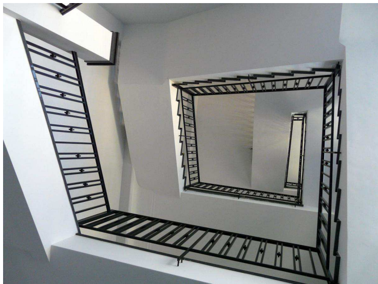
Les escaliers secondaires ont été rénovés à l'identique.