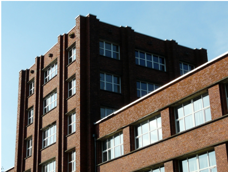
Des ressauts verticaux en briques accentuent l'élanement du corps central des bureaux.