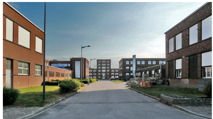
Vu depuis l'extrémité de l'axe central, le bâtiment des bureaux clôt la perspective.