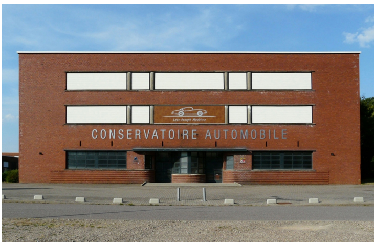
Ici, la façade principale se distingue par ses formes courbes, ses bandeaux vitrés et sa structure en béton visible ponctuellement.