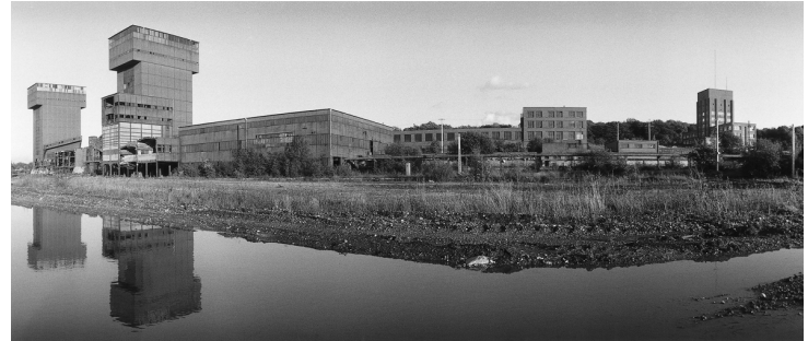
Le carreau en 1990, avant démantèlement des installations de production.