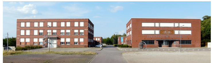
Implantés selon l'axe de symétrie central structurant le site, les deux bâtiments possèdent une volumétrie identique en miroir. En revanche, leur composition de façade différenciée propose de subtiles variantes.