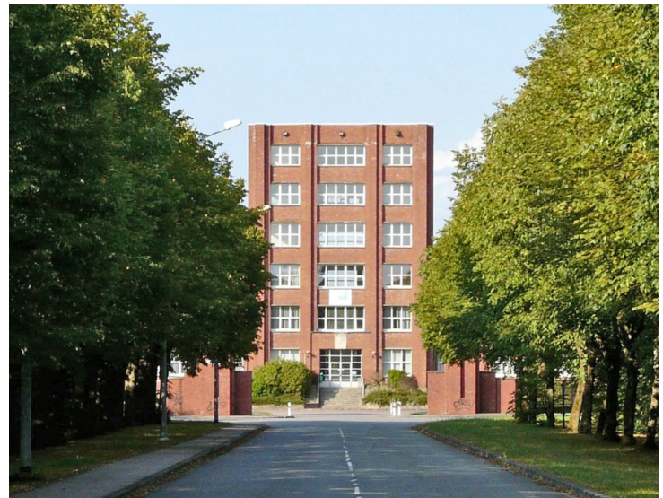
Une allée plantée met en scène les anciens bureaux, situés à l'entrée du site.