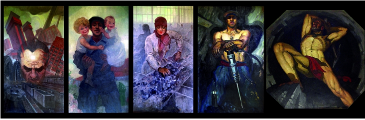
Les cinq panneaux de la fresque de Charles Garry ornent le hall d'entrée des anciens bureaux.

Source : Fresque de Charles Garry/Photos District Urbain de Faulquemont