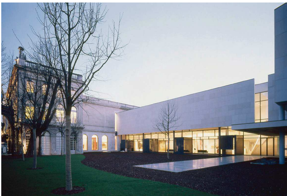
Atelier Beaudouin