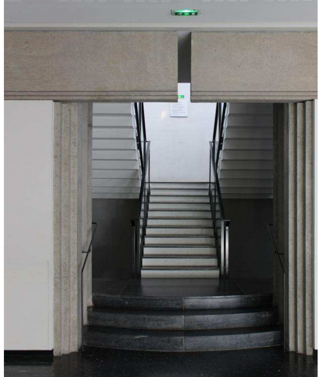
Les nuances allant du blanc au gris, les matériaux durs et la stricte géométrie caractérisent l'ouverture sur la galerie principale.