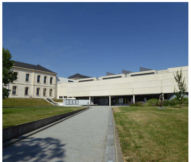
Au quotidien, personnels et visiteurs entrent latéralement au cœur de la rue centrale reliant différents bâtiments.