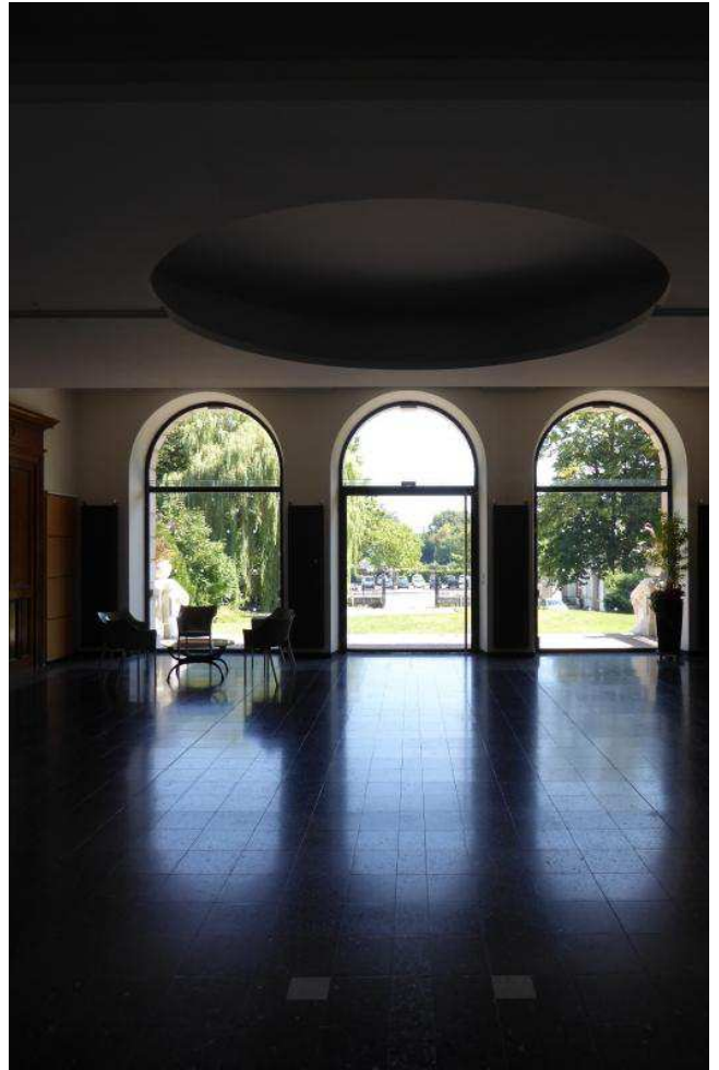
L'ancienne entrée est munie d'une large porte vitrée ouverte pour des occasions exceptionnelles.