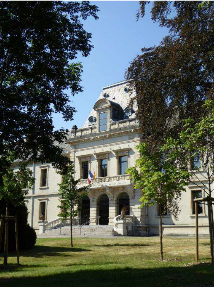
Placé dans l'axe d'une composition urbaine monumentale imaginée au XIXe siècle, le corps central de l'hôpital militaire montre l'importance de l'institution.