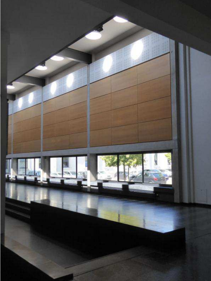
Pierre, béton, bois et métal sont associés en un vocabulaire sobre et selon une mise en oeuvre soignée.