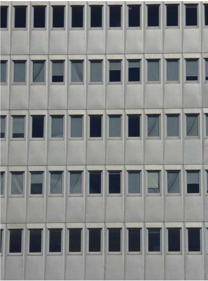
Les façades-rideaux sont composées de panneaux métalliques légers, préfabriqués en usine.