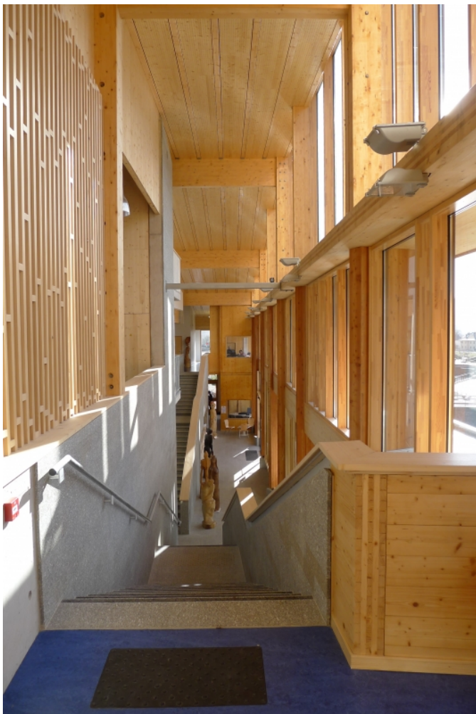
Baigné de lumière naturelle, animé par les escaliers, balcons et coursives, unifié par l'omniprésence du bois, le hall constitue l'espace le plus remarquable de l'édifice.