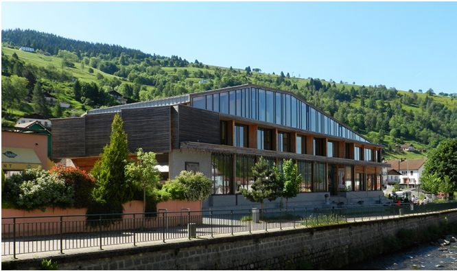
Le bâtiment développe ses lignes horizontales le long de la rivière.