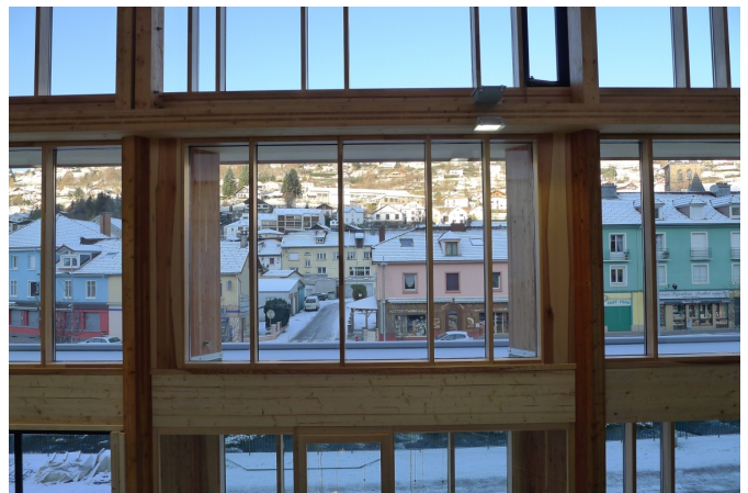
La composition savante de la façade principale multiplie les cadrages sur la ville et le paysage.