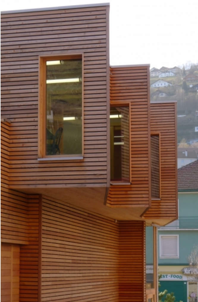
La façade latérale s'anime de redents successifs.