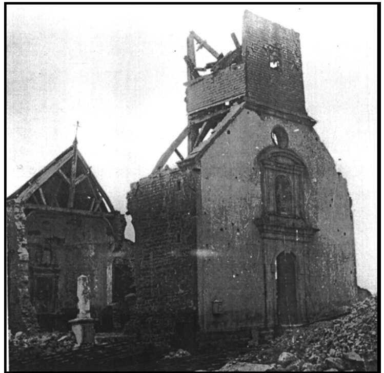
Les ruines de l'ancienne église datée du XVIIIe siècle, incendiée en 1940