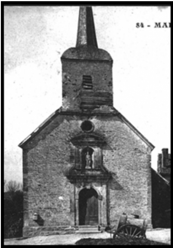
L'ancienne église datée du XVIIIe siècle avant sa destruction