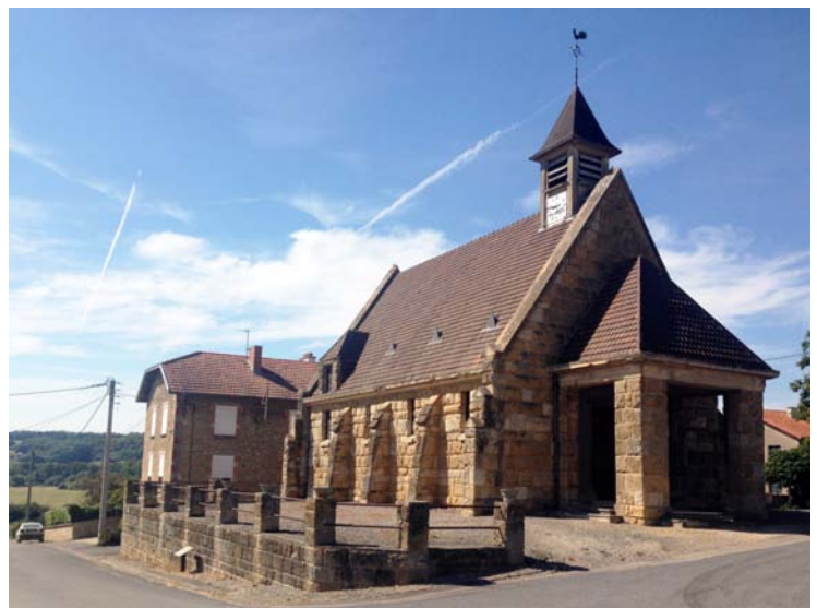
La façade d'entrée s'ouvre sur une place, située au cœur du village, repensé après la Seconde Guerre mondiale.