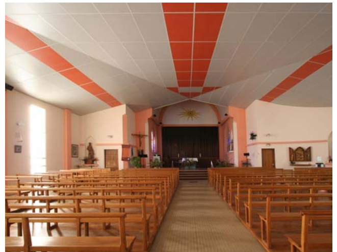
L'espace intérieur de la nouvelle église garantit une visibilité optimum du sanctuaire.