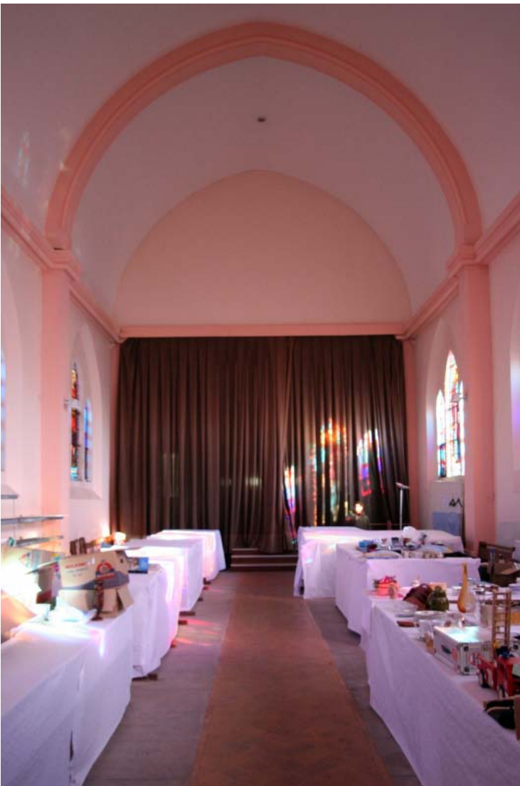
Un rideau délimite l'ancienne chapelle et la nouvelle église sans pour autant les clôturer.