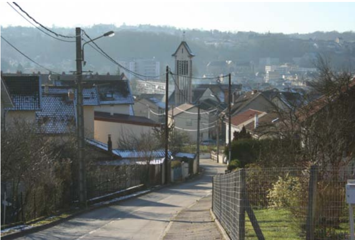
L'église Saint-Charles depuis la voie communale dite de "la Côte des fourches".