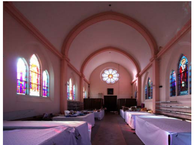
Une nef simple voûtée en berceau brisé est éclairée et magnifiée par une rosace et des vitraux de G. Janin.