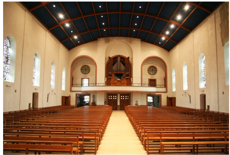
Légèrement en porte-à-faux, la tribune, placée face au chœur, domine la nef.