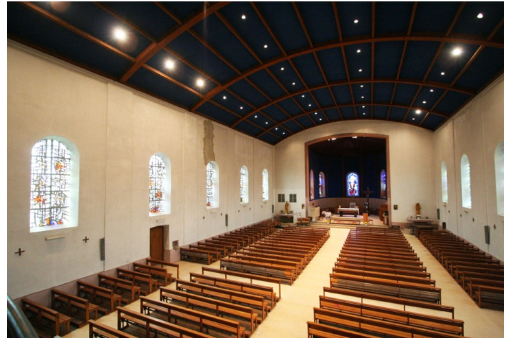
La nef s'insère dans un plan rectangulaire à vaisseau unique couvert d'une voûte en berceau.