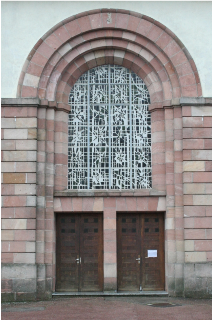
Le portail d'entrée est souligné par des blocs de grès rose des Vosges.