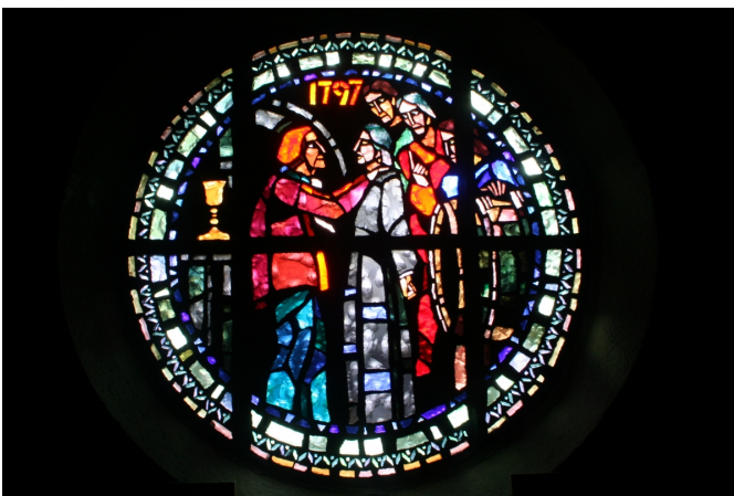
L'une des roses de la tribune rappelle l'épisode de l'abbé Poirot du Brabant de 1797 : des patriotes en bonnet rouge viennent de le découvrir sous un couvercle.