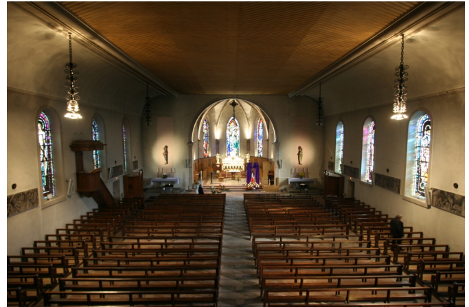
La nef, couverte d'un plafond plat, se développe sur un plan rectangulaire, sans bas-côté ni chapelle latérale.