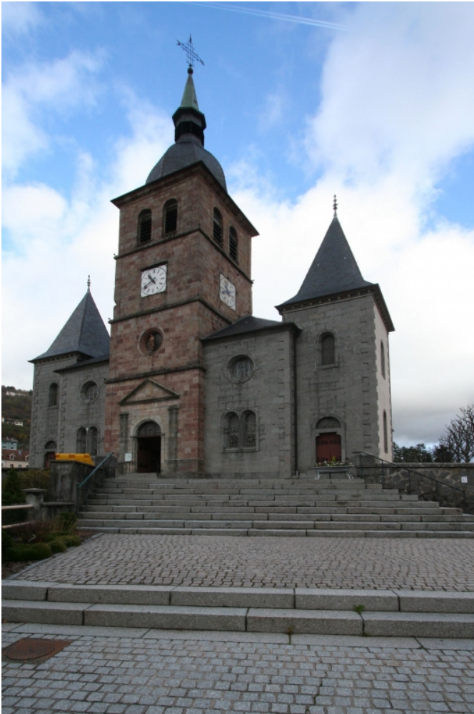
La façade d'entrée, épargnée par les destructions, date des XVIIIe et XIXe siècles.