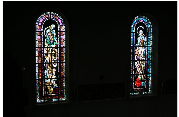
Ces deux verrières représentent les apôtres Saint-Jean (à gauche) et Saint-Jacques (à droite), tous deux associés à un prophète.