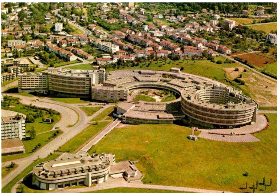
Carte Postale