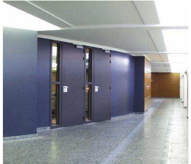
Un espace de circulation est savamment créé entre l'amphithéâtre courbe et la boîte parallèle qui le contient.

Droits : Agence François & Henrion architectes urbanistes