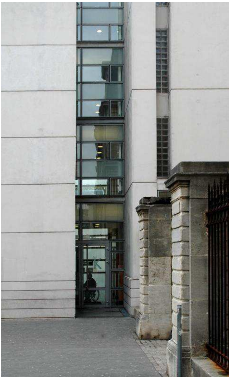
L'ancien et le moderne voisinent à proximité de l'entrée, nichée dans une fente.

Droits : Agence François & Henrion architectes urbanistes