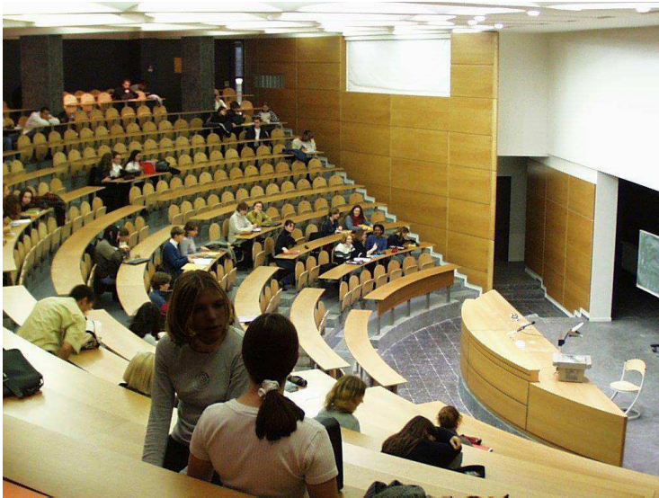
Dans l'amphithéâtre, les teintes chaudes du bois dominant.