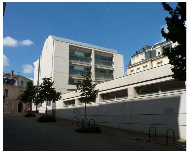
L'extension comprenant un parking sous-terrain a permis de rendre aux piétons le passage