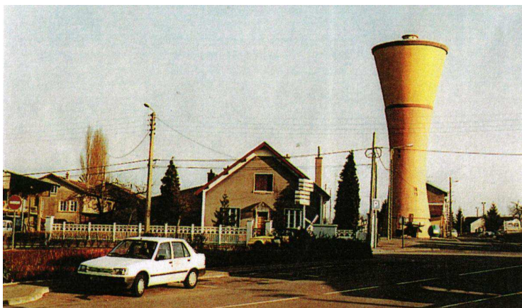
Le château d'eau se dresse au cœur des habitations de Moutiers-Haut, comme l'illustre cette photographie de 1995.