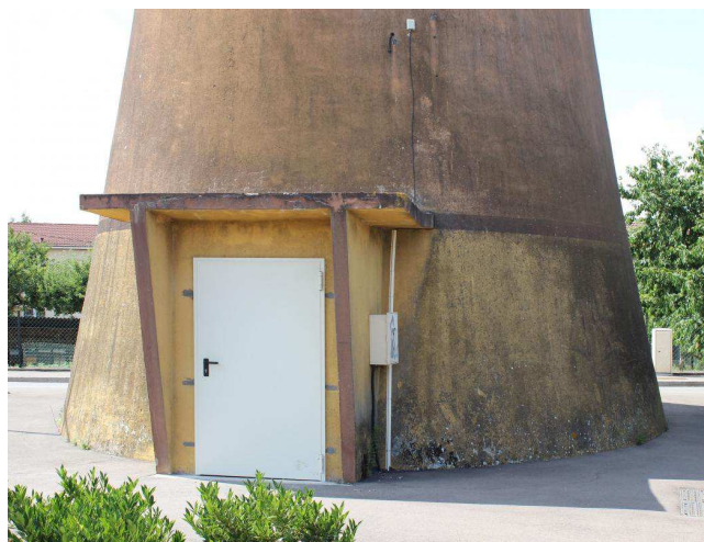
L'auvent signalant l'entrée est la seule émergence de l'ouvrage.