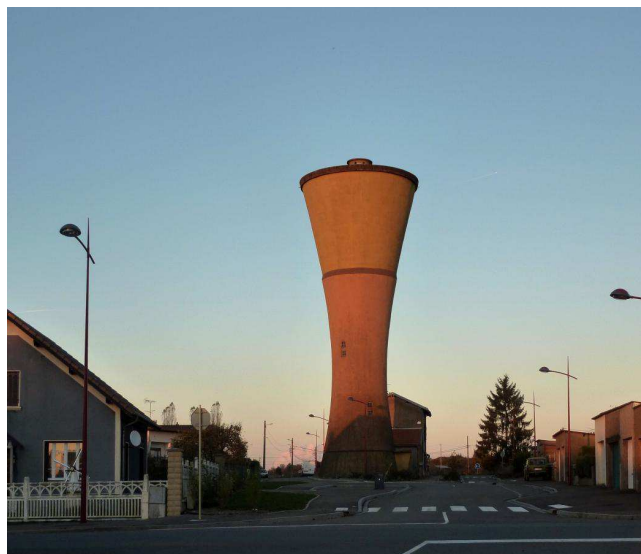
Le soir venu, les teintes jaune et orangée du château d'eau tirent vers le rouge.