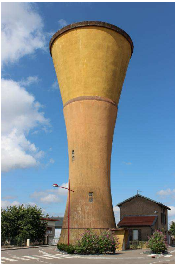
La silhouette du château d'eau décrit une hyperbole.