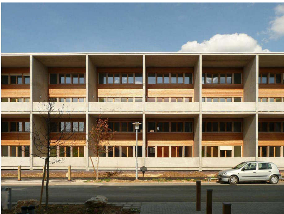
Agence Canonica-Cartignies - © Agence Canonica-Cartignies