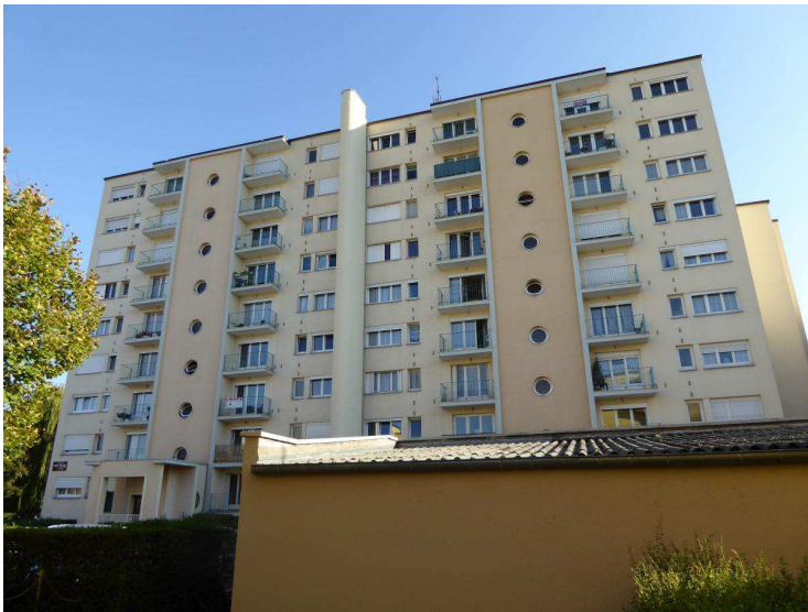
La barre principale fermant l'ensemble au sud montre la composition la plus sophistiquée.