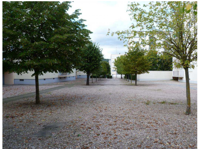
Les larges allées plantées participent de la composition classique d'ensemble.