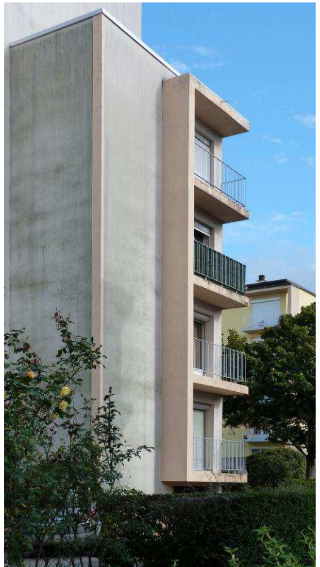
Les angles sont soulignés de balcons offrant une double orientation.