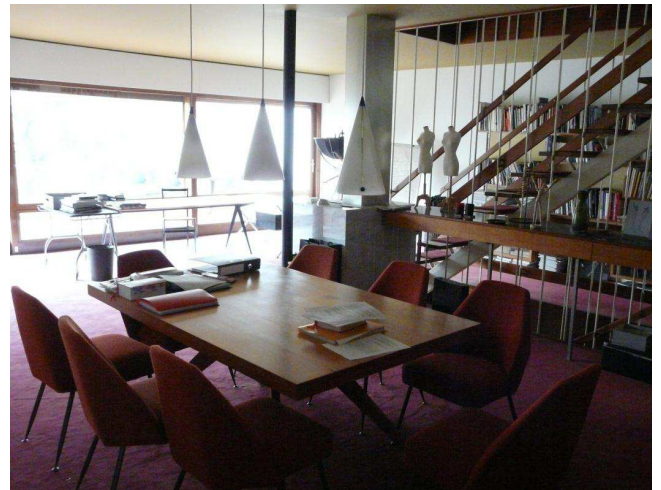
Le séjour est prolongé par une baie vitrée et une terrasse côté jardin.