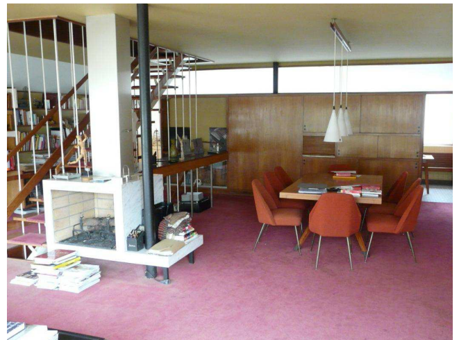
Le séjour est séparé de la cuisine par un meuble passe-plat et un bandeau vitré.