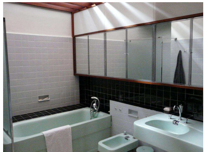
La salle de bains bénéficie d'un éclairage zénithal.