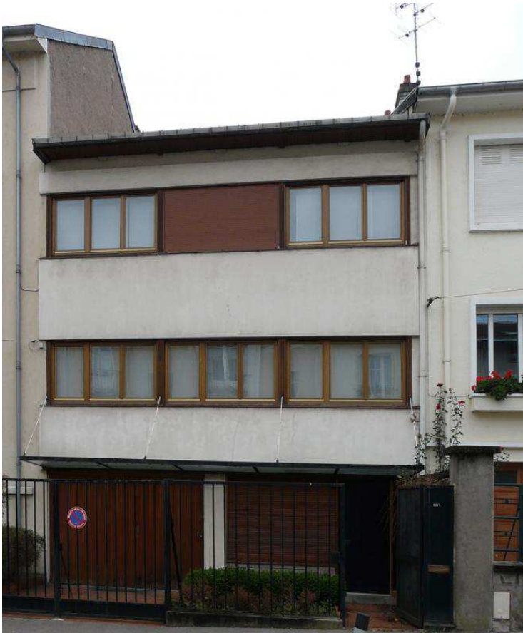
La façade sur rue, très sobre, permet à cette maison de s'intégrer parmi d'autres, plus anciennes et plus traditionnelles.