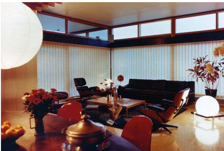
Les fauteuils en bois et en cuir sont dus au designer américain Charles Eames.