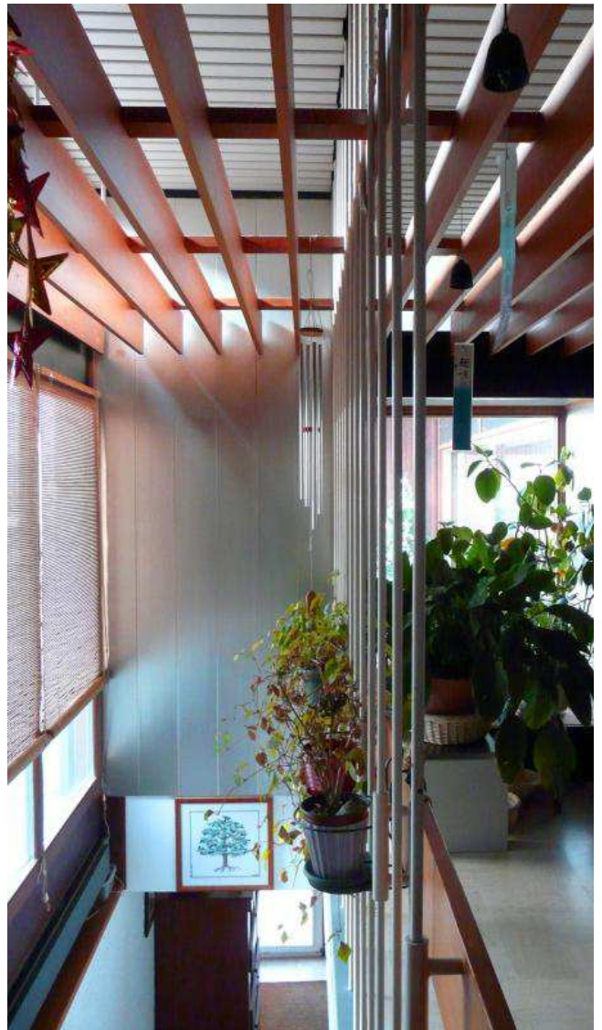
Les intérieurs sont lumineux, grâce aux nombreuses ouvertures en façade.