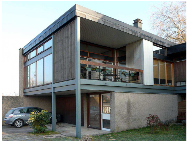
Le salon s'ouvre sur un balcon séparé de la rue par un écran.